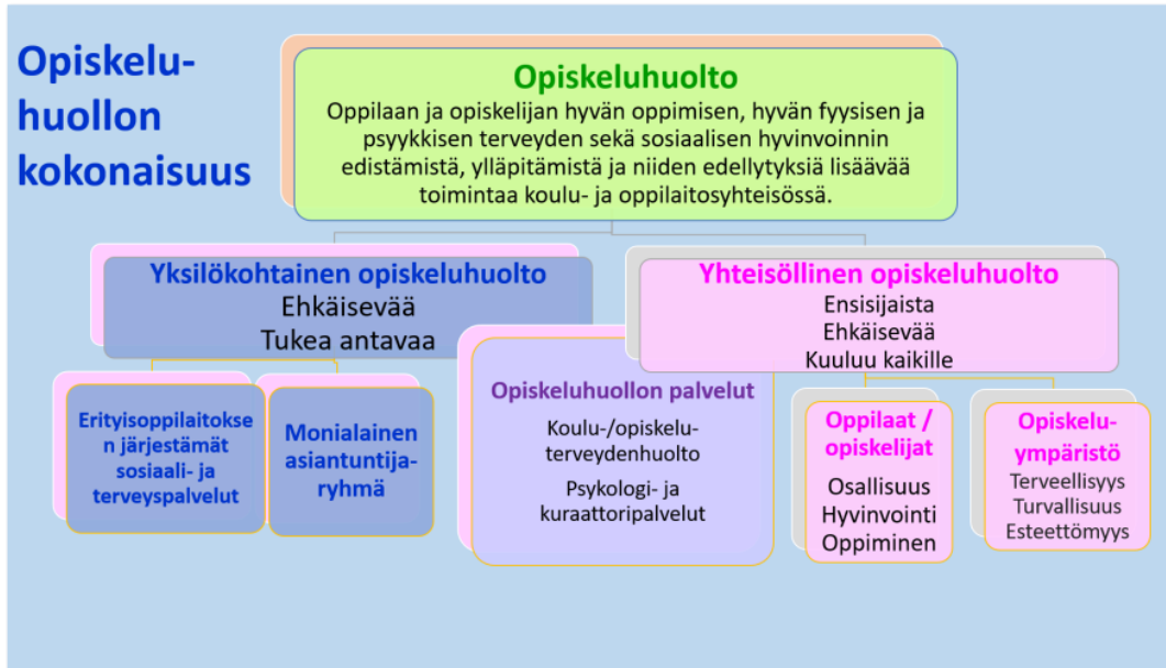
Kuvio 1. Opiskeluhuollon kokonaisuus.